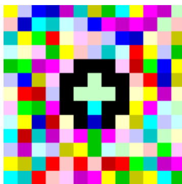
«HelloWorld!» на языке Piet

командой с двумя параметрами: канал R используется для кодирования команды, а G и B — для кодирования параметров.