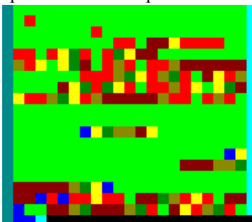
«Hello World!» на языке Brainloller

Этот эзотерический язык разработан LodeVandevenne в 2005 году. Brainloller является двухмерным клоном Brainfuck с дополнительными командами, позволяющими управлять поворотом указателя, поэтому используются 10 цветов: 8 для основных команд, 2 — для поворота на 90 градусов по/против часовой стрелки.