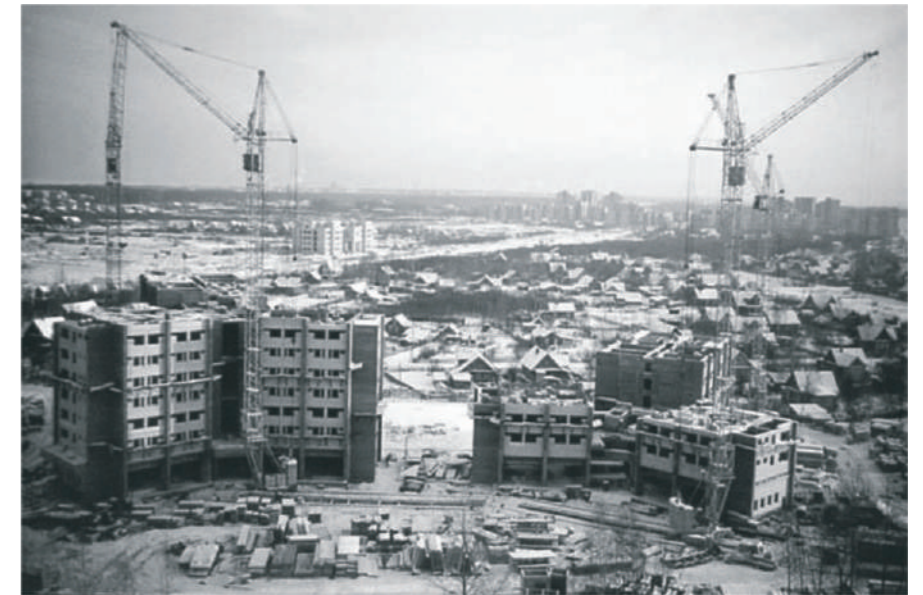
Строительство 14 и 15 общежитий

На первом же заседании В. И. Зубов обозначил 3 основных направления деятельности: развитие работы по теории процессов управления, управление технологическими процессами и еще одно направление, связанное с распределением сил и средств. Эта задача связана, прежде всего, с функционированием крупных машинных комплексов и с автоматизацией сложных систем.